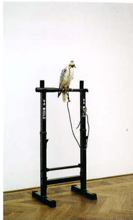
Anne Imhof „Falcon Stand (HOLE)“, 2016

„Es geht um den Gedanken und wie es aussieht, wenn er das Bewusstsein verlässt“