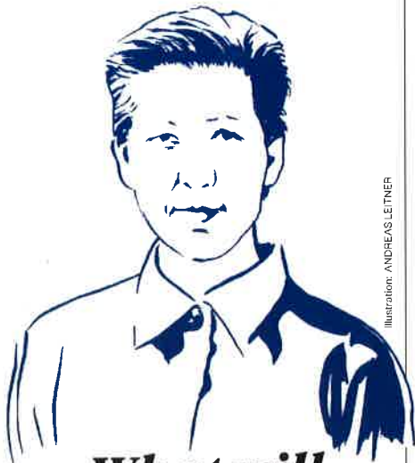
Illustration: ANDREAS LETNER